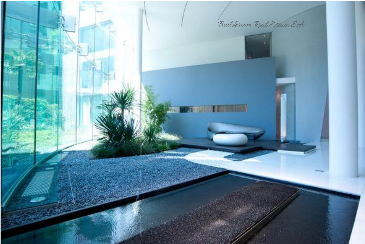
Atrio Palazzo Mantegazza