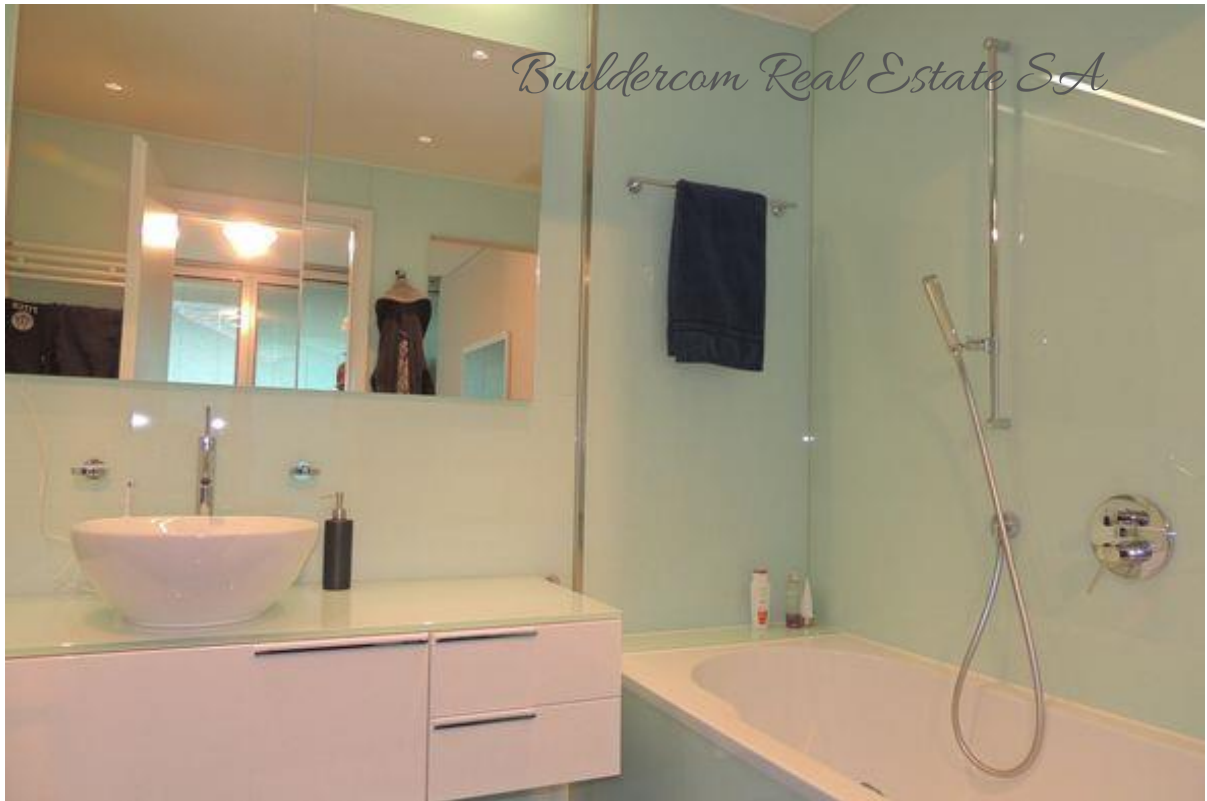
Bagno con vasca