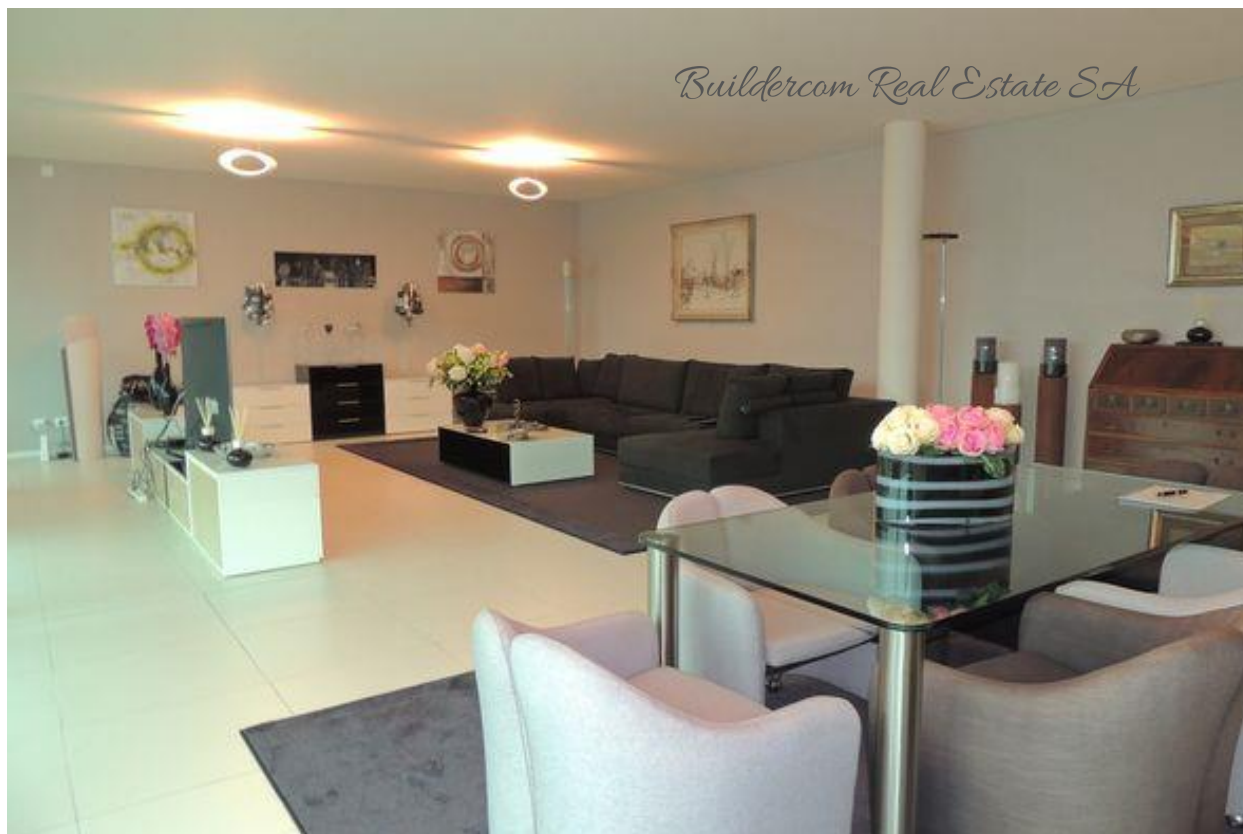
Soggiorno e sala pranzo