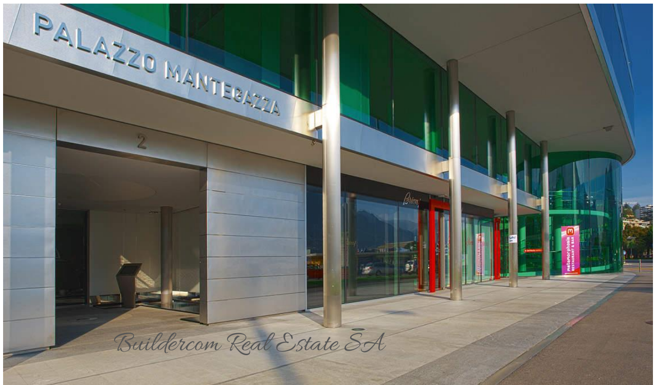
Entrata principale Palazzo Mantegazza